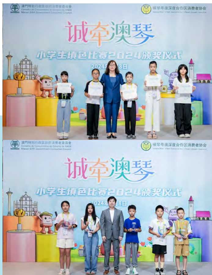
頒獎儀式上向兩地獲獎學生頒發獎狀 Na cerimónia de entrega de prémios, foi atribuído um certificado aos alunos premiados dos dois locais